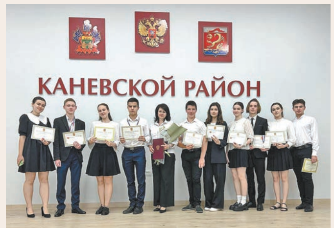
Учащиеся гимназии – победители олимпиад и конкурсов

Неоднократно гимназия входила в перечень ТОП 200 среди лучших сельских школ РФ и ТОП 100 муниципальных и государственных общеобразовательных организаций Краснодарского края, обеспечивающих высокий уровень подготовки выпускников. Ежегодно наши гимназисты становятся победителями и призёрами научно-практических конференций «Эврика», «Шаг в будущее», во всероссийских предметных очных и дистанционных олимпиадах. Совместно с опытными педагогами гимназисты выпускают газету «Камертон», где рассказывают о жизни школы, анализируют и обобщают, а самое главное – общаются, передают свои знания другим. Команда юнкоров ежегодно становится призёром краевого